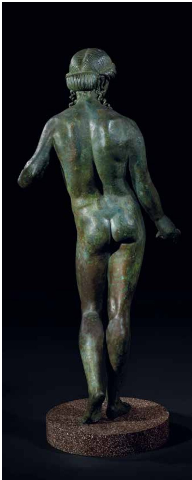
Apollon Citharède. Seconde moitié du II e siècle av. J.C.

Bronze : 68 cm. Provenance : région de Pompéi. Ancienne collection Durighello.