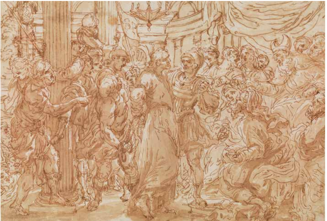
Le Christ devant Caïf de Johan Carl Loth (1632-1698)