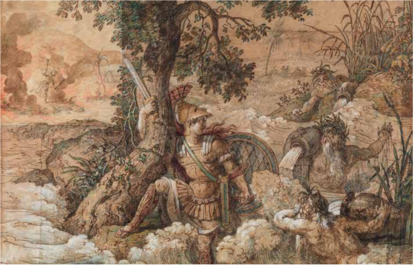
La colère d'Achille, 1752, entourage de Charles-Joseph Natoire (1700-1777)